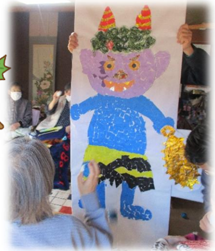
↑「別家」に大きな鬼がやってきました。 皆さんと一緒に張り紙した作品。ワオーと聞こえてきそう！！