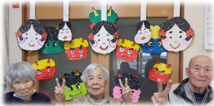
「まつお」の可愛い鬼たちの勢ぞろい！ 手前の3人さんは鬼の引き立て役です。↑