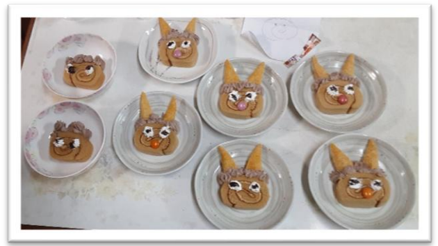
「松島」の鬼です。とても食べられそうにありません。どの鬼が優しそう、強そうかな。でも美味しそう！