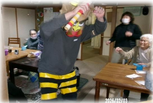
「三日市場」の鬼！何か気の良い鬼のようです。 豆を投げるご利用者さんの方が気合が入ってる！！