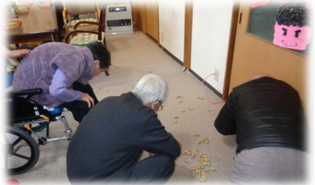
蒔いた豆をもったいないと拾って頂きました。