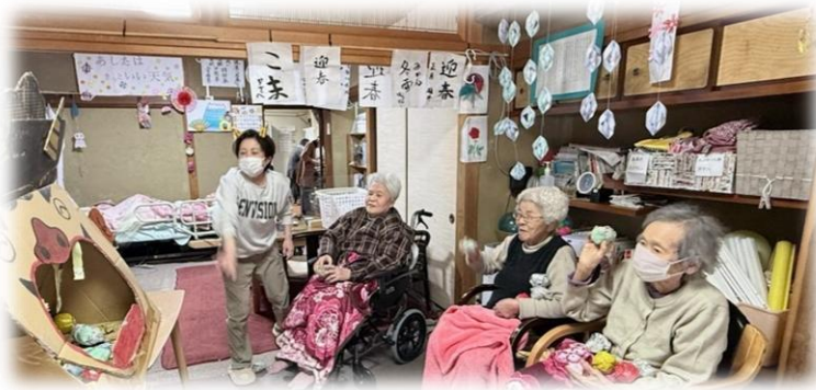
「さくらまち」の鬼退治です。皆の倅せがやってくるように祈りながら 力いっぱい投げてる三人官女さんです。と、オマケの職員です。